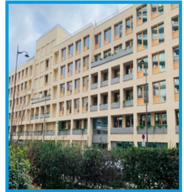
Site Miollis - locaux de la DRIEAT

La Mission d'inspection générale territoriale (MIGT) de Paris est localisée sur le site de Miollis, dans le 15 e arrondissement de Paris, au sein des locaux de la DRIEAT (direction régionale et interdépartementale de l'environnement, de l'aménagement et des transports). De 2023 à 2025, ce site a bénéficié d'une rénovation thermique et énergétique complète, financée par le plan France Relance.