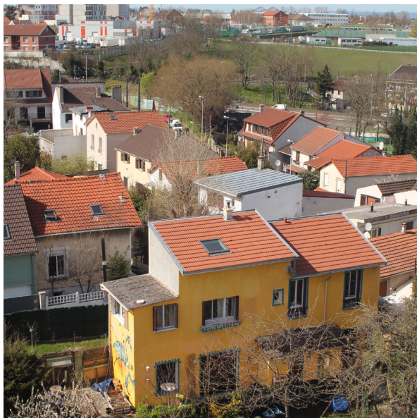
Quartier d'habitat pavillonnaire, Noisy-le-Sec.

Les quatre conférences de ce cycle 2021/2022 souligneront à la fois l'objectif commun des opérations d'aménagement (produire de l'urbain et de l'urbanité) et l'éventail très ouvert des programmes et des réalisations.