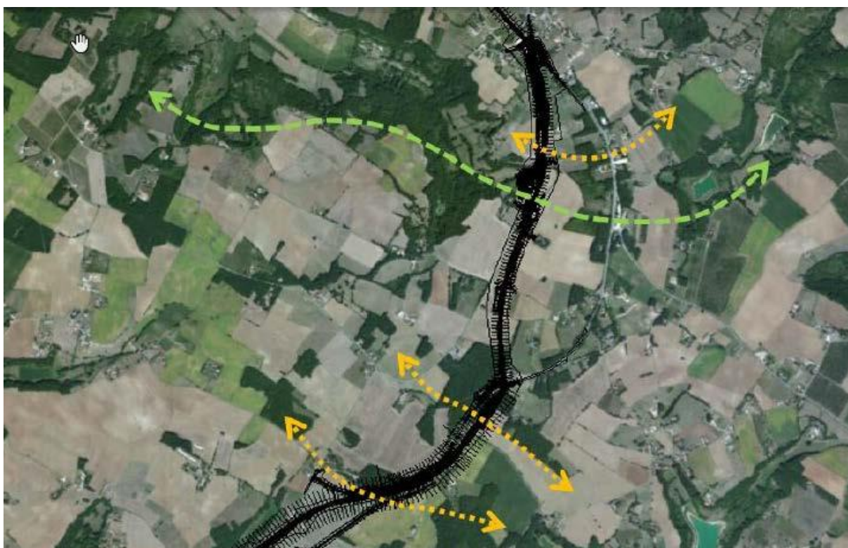
Figure 3 : Carte des continuités écologiques. En vert : Principale continuité écologique. En jaune : continuité écologique secondaire.

Le dossier met en évidence une continuité écologique « principale » et trois « secondaires » qui sont traversées par les sous-sections 1 et 2. Elles sont constituées d'une trame « multiple » et d'une trame boisée dans la partie nord de la déviation de Monbalen, ainsi que d'une pelouse sèche dans sa partie sud. La RN21 est bien identifiée comme un élément fragmentant d'ores et déjà ces corridors et le projet comme un facteur accroissant cette fragmentation.