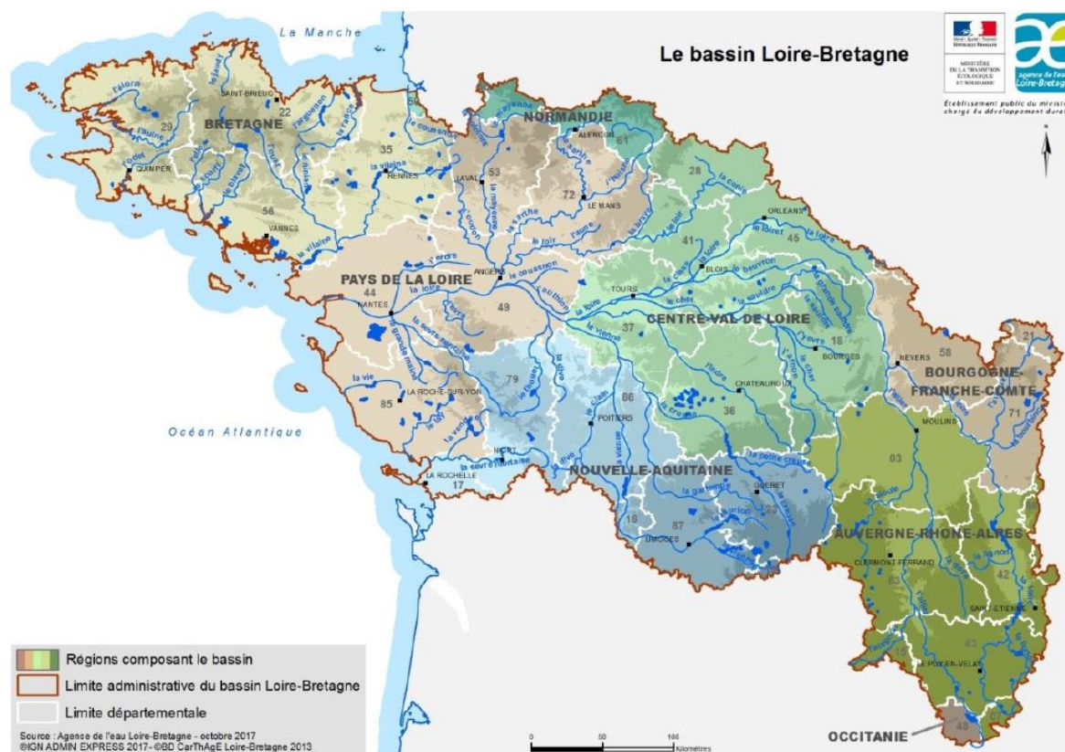
Figure 2 : Le bassin Loire-Bretagne

cinquante mille habitants mais présente néanmoins un caractère rural et agricole, avec deux tiers de l'élevage et la moitié de la production de céréales nationaux. Si les TRI correspondent aux territoires qui pourraient être les plus fortement affectés à l'avenir, l'EPRI souligne que « de nombreux autres territoires seront touchés par des phénomènes plus fréquents avec déjà des dommages conséquents ».