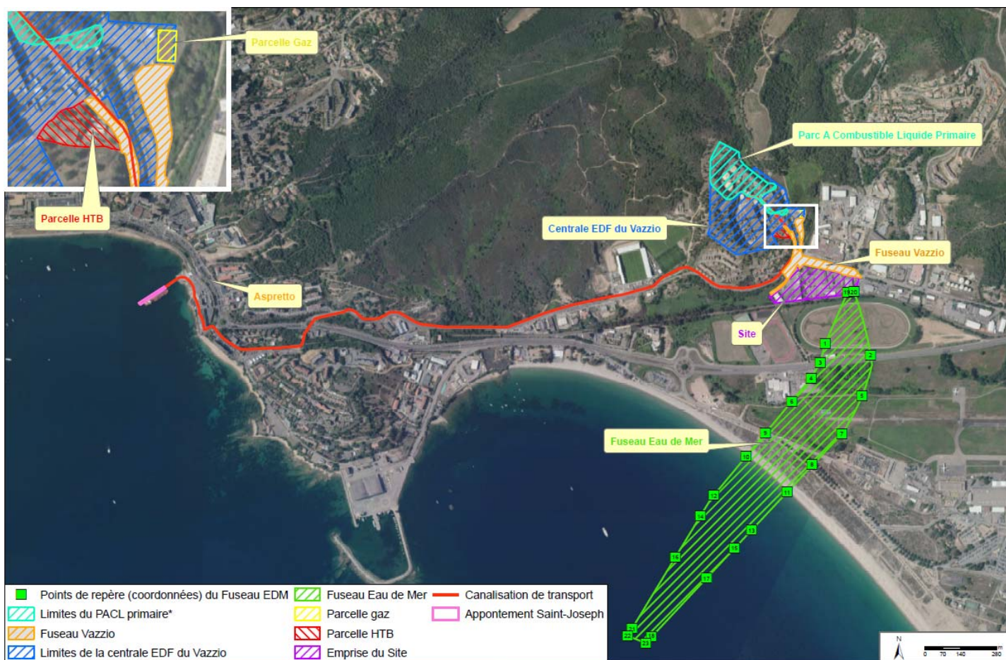
Figure 3 : Zones géographiques du projet présenté

L'Ae recommande de compléter le dossier en précisant les modalités d'acheminement et de stockage, temporaire ou permanent, aussi bien pour les déchets inertes que pour les sites de traitement des déchets pollués.