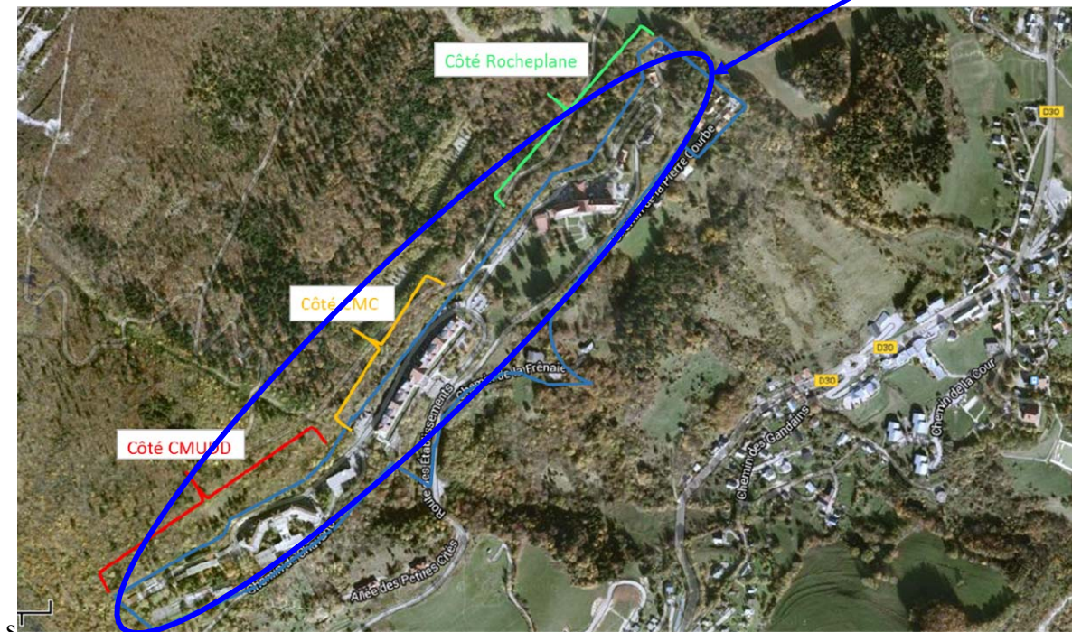
Figure 1 : localisation du site