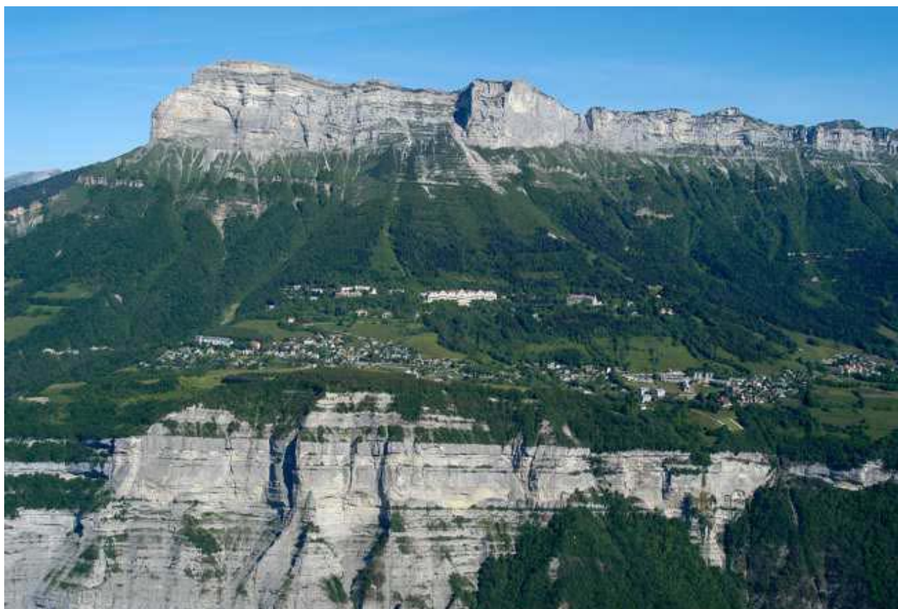
Figure 3 : vue lointaine sur les établissements

Les bâtiments à démolir sont situés sur un plateau situé à 1 000 m d'altitude et sont visibles depuis la plaine.