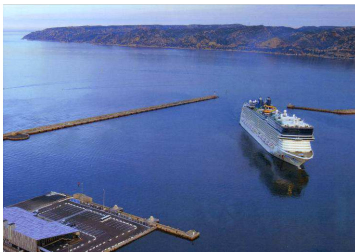
Figure 1: vue d'un navire de croisière venant de franchir la passe nord (Extrait de la plaquette du GPMM)

Les dimensions de la passe d'entrée et des bassins de manœuvre du port de Marseille sont devenues insuffisantes pour que de tels navires puissent manœuvrer en sécurité en tout temps (Figure 1). Le port ne peut aujourd'hui accueillir que des navires jusqu'à 333 m de long, 38 m de large et d'un tirant d'eau de 8,65 m. On constate dès aujourd'hui des renoncements à accoster 9 à Marseille par vent de mistral (nord-ouest) supérieur à 25 nœuds (46 km/h), soit en moyenne 60 jours par an.