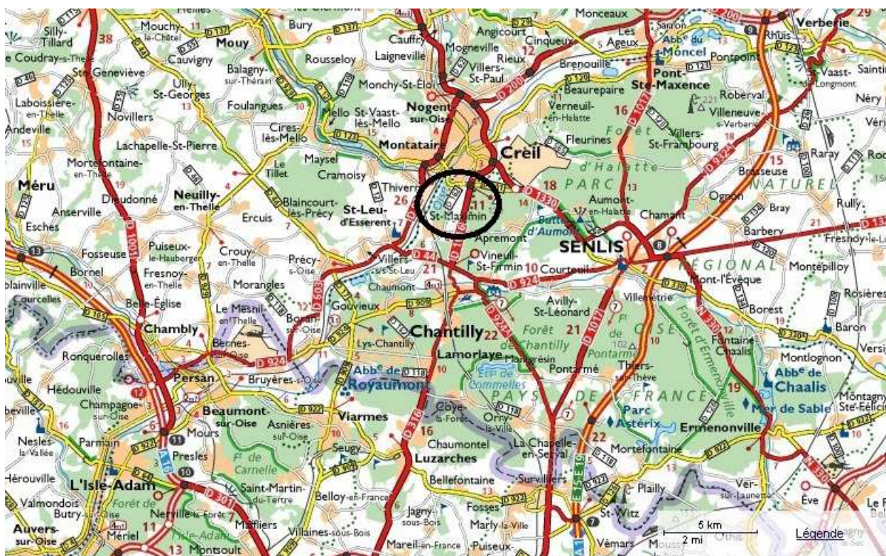
Plan de situation du projet

Le projet de création d'un passage inférieur à la RD 1016 pour un accès sud à la zone commerciale de Saint-Maximin (Oise) est présenté par le conseil général de l'Oise. Il consiste à réaliser un carrefour dénivelé souterrain sur la route départementale (RD) 1016 à 2 x 2 voies, pour desservir la zone commerciale dont l'extension est en cours en partie sud.