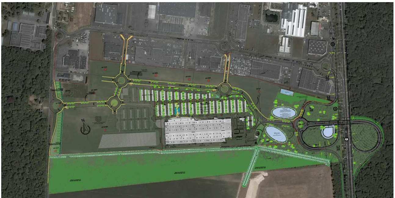
Schéma d'ensemble de l'extension sud de la zone commerciale, comprenant notamment la nouvelle implantation du magasin Castorama, ainsi que la réalisation de voiries nouvelles - dont celle de l'échangeur avec la RD 1016 (en bas à droite)

L'échangeur prévu comporte des bretelles situées de part et d'autre de la route (ouest et est) et un passage souterrain.