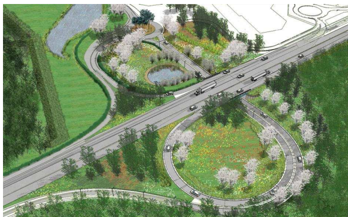
Illustration prospective du projet prévu

Le montant total des travaux s'élève à 4,2 M€, dont 3 M€ pour les accès routiers et 0,730 M€ pour l'ouvrage souterrain.