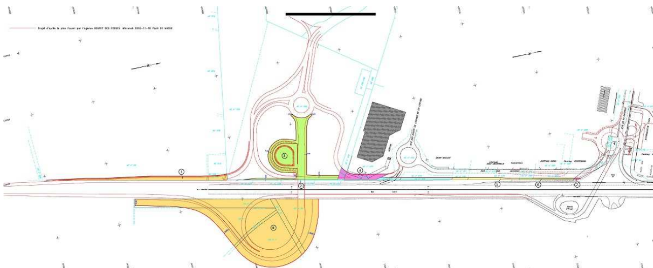
Emprise parcellaire faisant l'objet de la déclaration d'utilité publique (parcelles colorées en jaune, vert, violet et bleu)